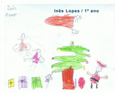
Inês Lopes / 1º ano