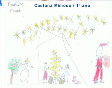
Caetana Mimoso / 1º ano