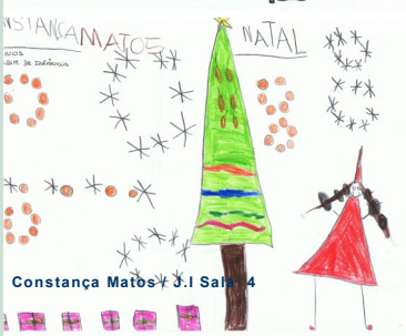
Constança Matos / J.I. Sala 4