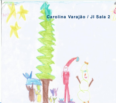
Carolina Varajão / J.I Sala 2