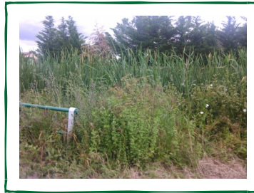
→ Poça da Truta ↓