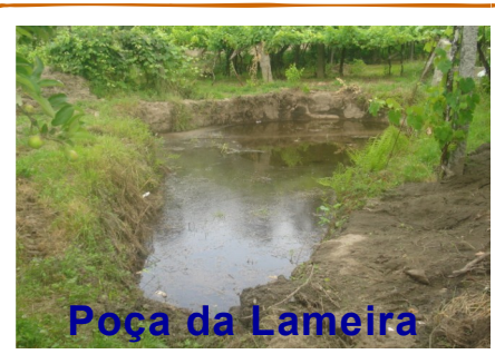
Poça da Lameira

A Junta de Freguesia deixa um apelo a todos os consortes das poças da Seara para que se reúnam e discutam a melhor forma de organizar a futura manutenção das mesmas, de forma a evitar que no futuro não seja necessária uma intervenção de fundo, como a que foi feita nesta ocasião.