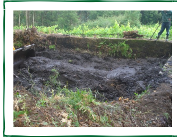
→ Poça da Carvalheira ↓