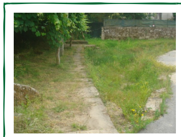
→ Poça de Ramos ↓